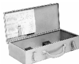
Valisette de transport 18000