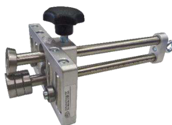
EcO-Bender4S1 91545S1 (200 mm, zonder O-handgreep) EcO-Bender4S4 91545S4 (350 mm, zonder O-handgreep)