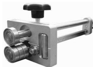
Mini-Bender4 200 91544100 / Mini-Bender4 350 91544100S3