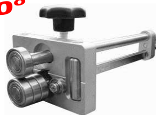
Mini-Bender 200 91544 / Mini-Bender 350 91544S3