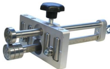
EcO-BenderS1 91545S1 (200 mm, zonder O-handgreep) EcO-BenderS4 91545S4 (350 mm, zonder O-handgreep)