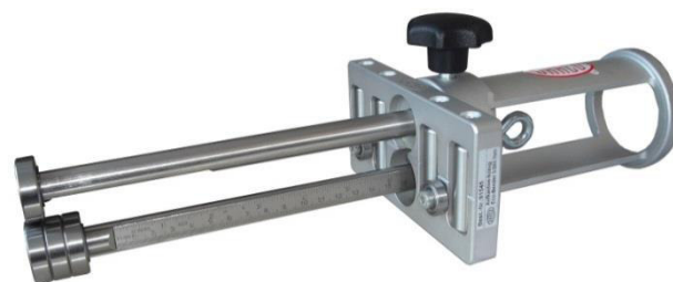
EcO-Bender3/200 mm 91545 / EcO-Bender3/350 mm 91545S3

3 optimale grijpmogelijkheden, altijd goede grip, ongeacht de lengte van de assen