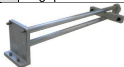
Adapter 91549 / 91549S3